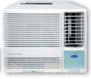
淨冷抽濕遙控型 (EPE系列)