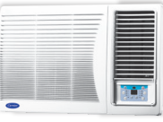
淨冷抽濕遙控型 (EPG系列)