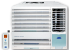
淨冷抽濕遙控型 (EPE系列)